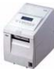
バーコードプリンター