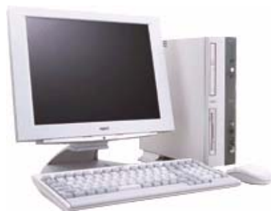
バーコード発行用 タッチパネル